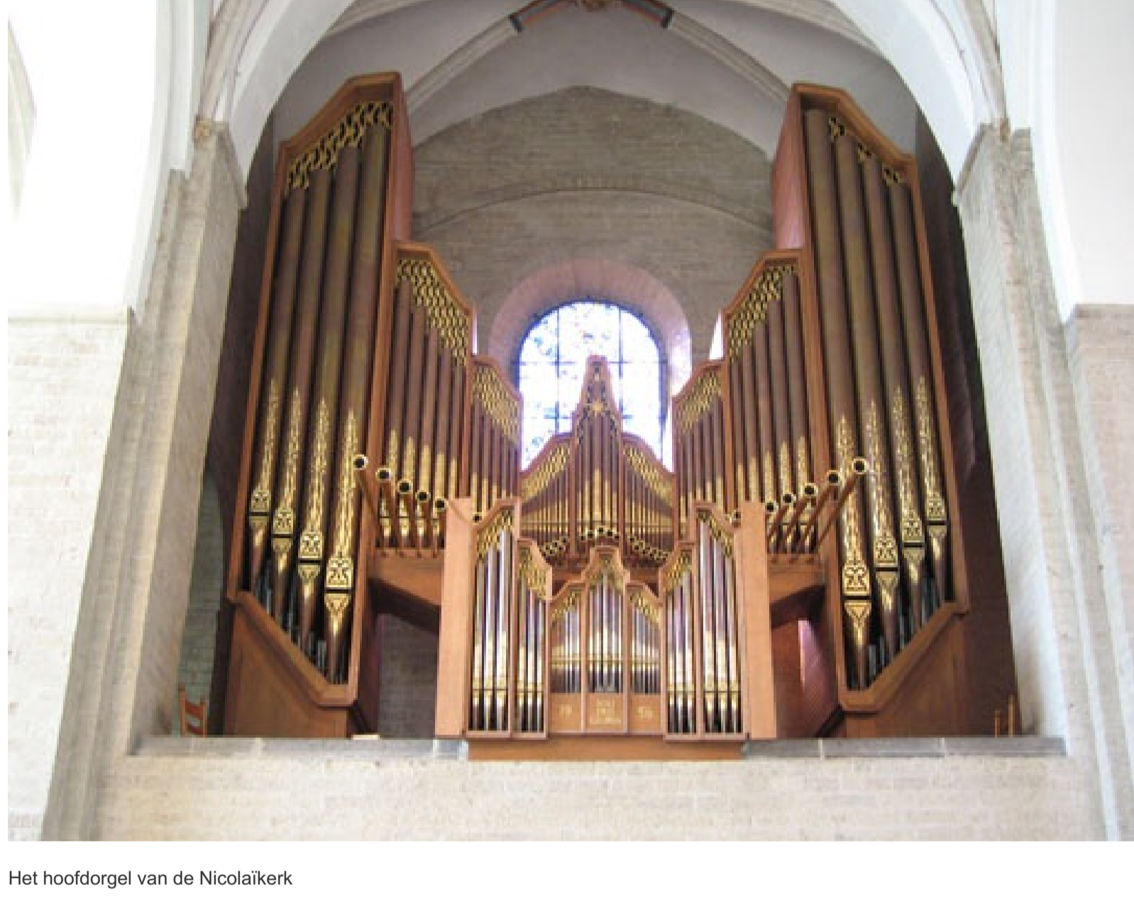
Het hoofdorgel van de Nicolaïkerk

Welke route je ook kiest, ze zorgen allebei voor een onvergetelijke muzikale dag tijdens Open Monumenten Dag.