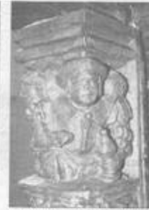
Een houten beeldhouwwerk met een herbergier in de Jacobikerk.