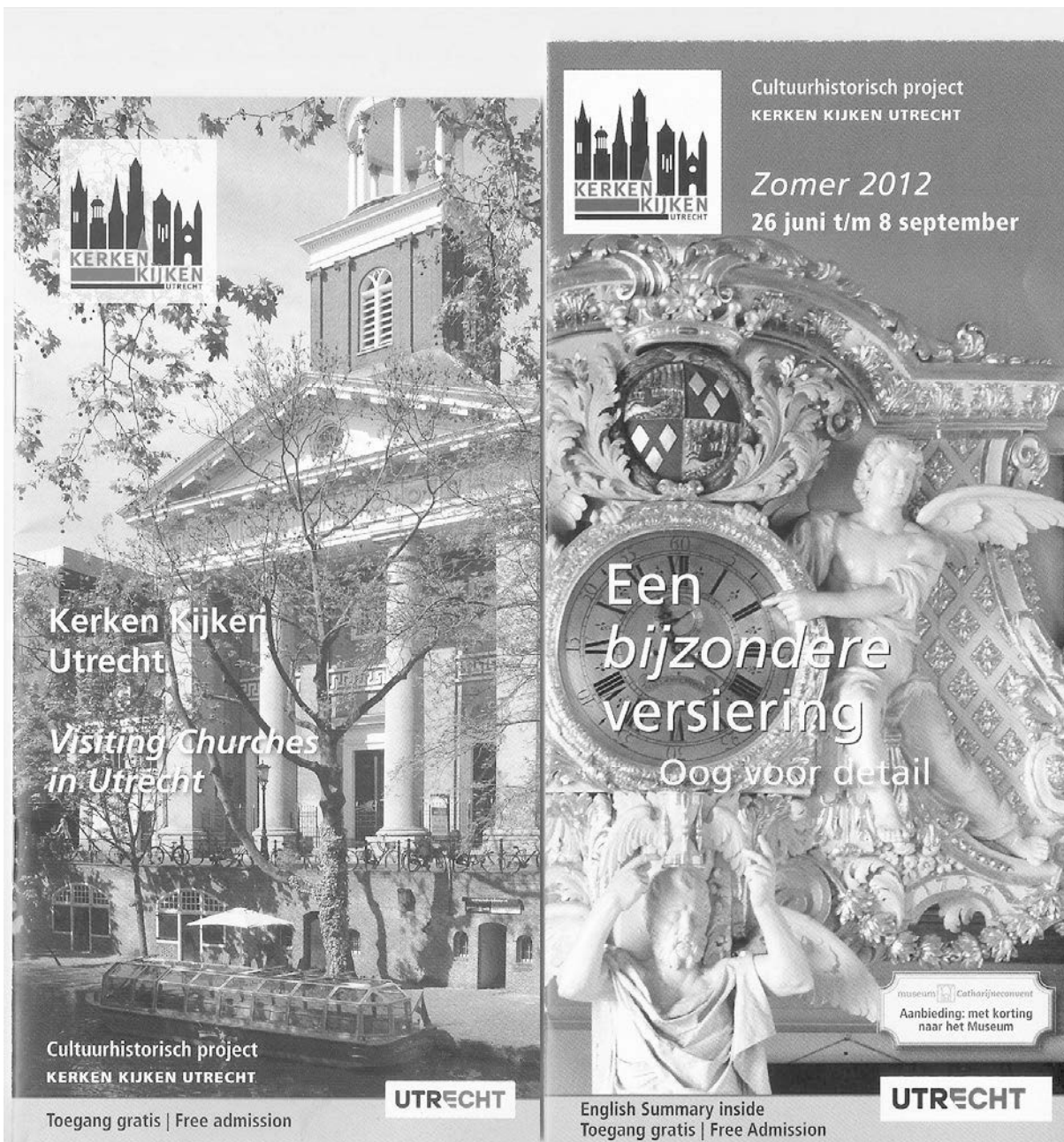
De nieuwe 'vaste' brochure van KKU (links) en de zomerfolder 2012 (rechts)