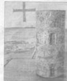
Mosaic kruis en vaas van kunstenaar Antoinette Gispert.

Museum Catharijnewijk biedt bezoekers op vertoon van de KKKU-seizoen 2012 tijdens Kerken Kijken 2,30 euro op de entreeprijs aan. Maximaal 4 personen.