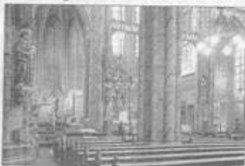
De Middekerk is heel anders dan andere kerken.

Vrijdag opende burgemeester Wubben het zomerproject met het thema van bijzondere versiering. Een zomer lang zijn twaalf kerken in de binnenstad open voor bezichtiging met of zonder mediating. Utrecht is van oudsher een stad en heeft veel kerken in het stadsbeeld. Dertig jaar