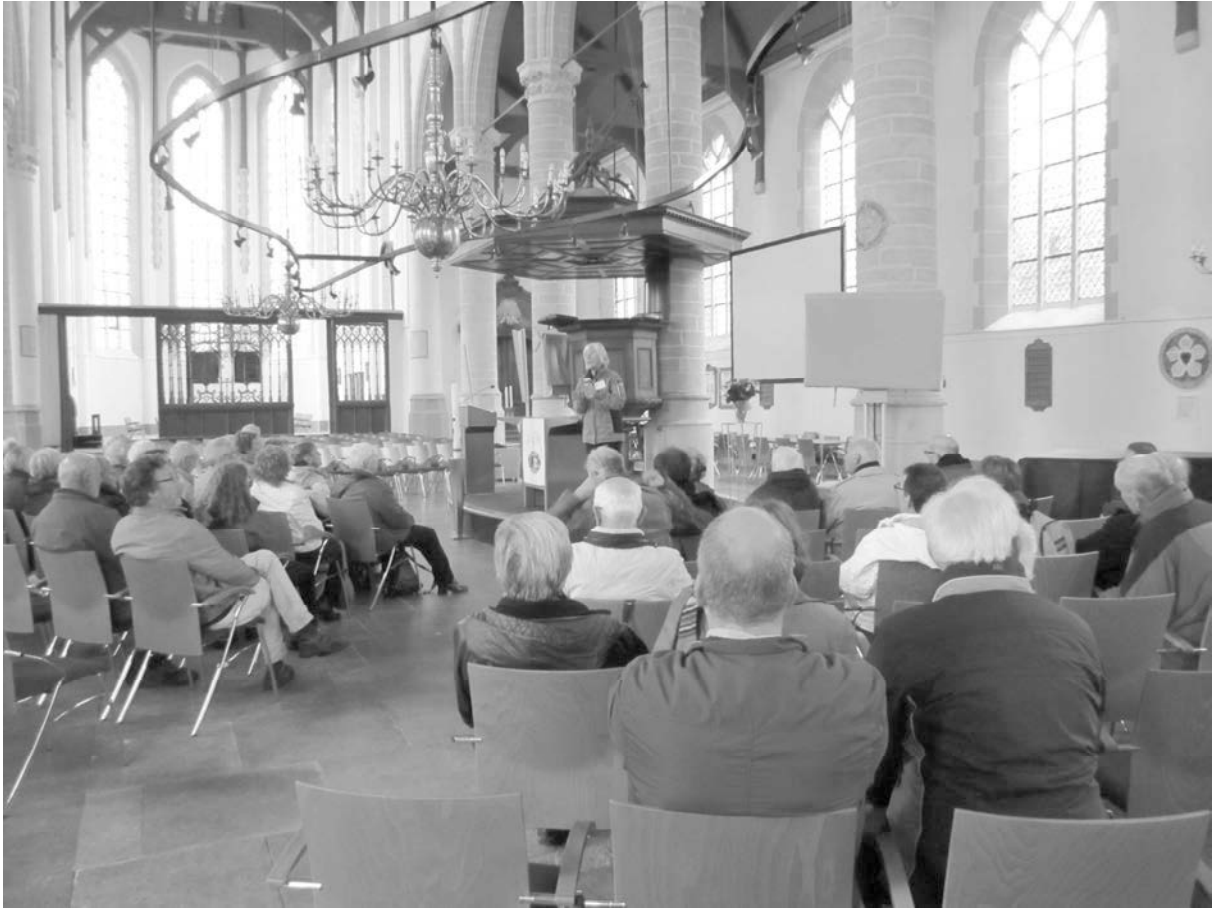
Beeld van de excursie. Aandachtige gidsen in de Laurenskerk te Weesp. Op de achtergrond het koorhek.